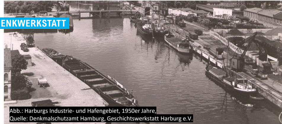
Abb.: Harburgs Industrie- und Hafengebiet, 1950er Jahre