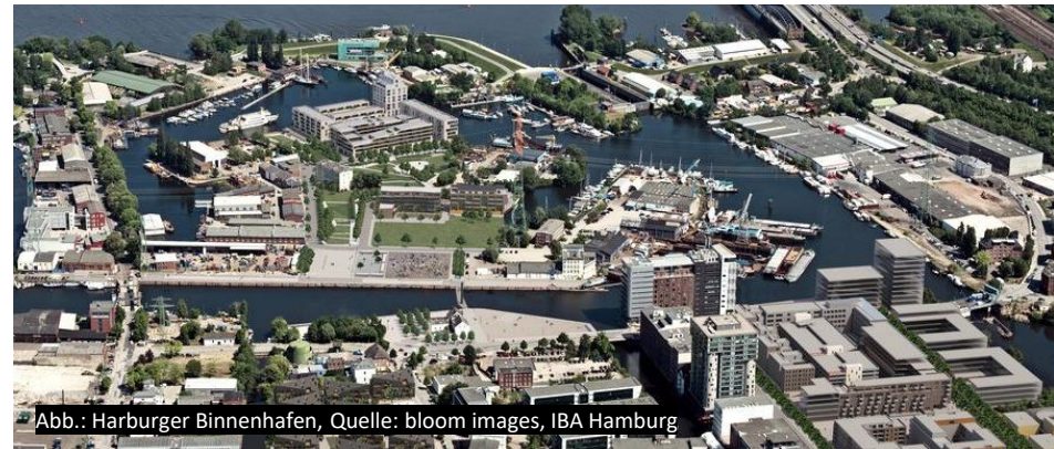
Abb.: Harburger Binnenhafen